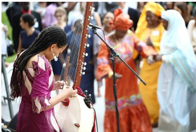
Foto: Sona Jobarteh bei einer Veranstaltung der Welthandelsorganisation 2017 1